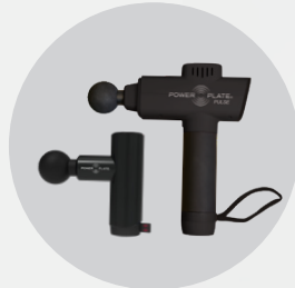
POWER PLATE® PULSE™